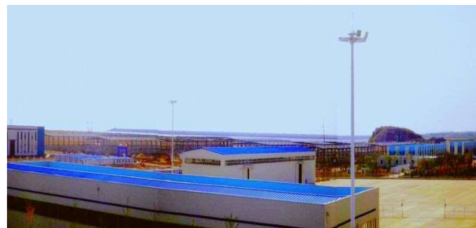
大連モデル園區で建設が進む新たな賃貸工場(17棟)

本システムは、古紙を大連市内の回収拠点で滞留させることなく処理・利用できる体制にするため、行政と民間そして製紙会社と連携をとる古紙回収システムである。