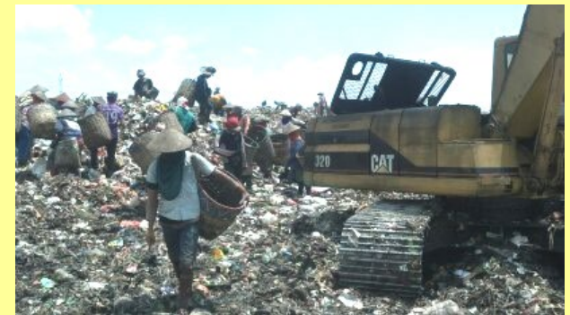
最終処分場の様子

重機の周りで1,000人以上のウェストピッカーが資源物を拾い集めており、非常に危険。危険物や不衛生なものも多くあり、怪我や病気になるしやすい環境。