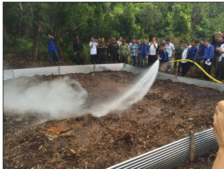
現地での消火実験の様子