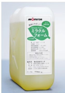
石けん系泡消火剤

そこで、本事業では過年度実施したJICA「中小企業海外展開支援事業～案件化調査～」の成果及び課題を踏まえ、現地での実証試験を通してシャボン玉石けん(株)の製品である環境配慮型石けん系泡消火剤の現地適応性の向上を図るとともに、同消火剤の普及・ビジネスへの進展を目指す。