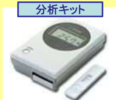
カドミウム含有量を測定