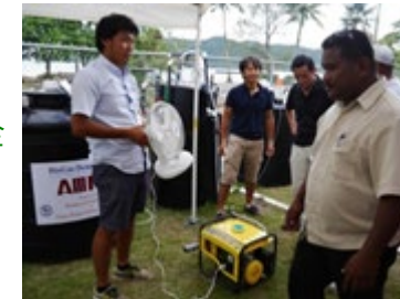
バイオガスデモ見学会