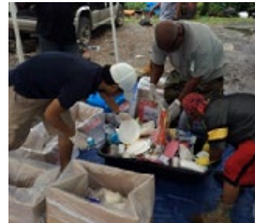
家庭ごみ組成調査実施風景