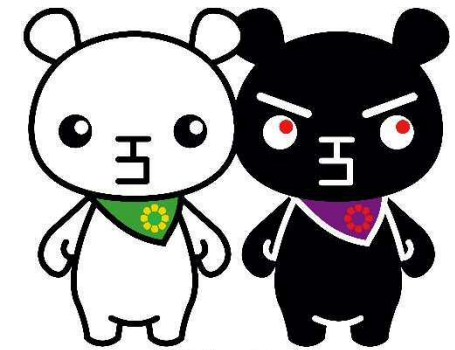
北九州市環境局マスコットキャラクター ていたん & ブラックていたん